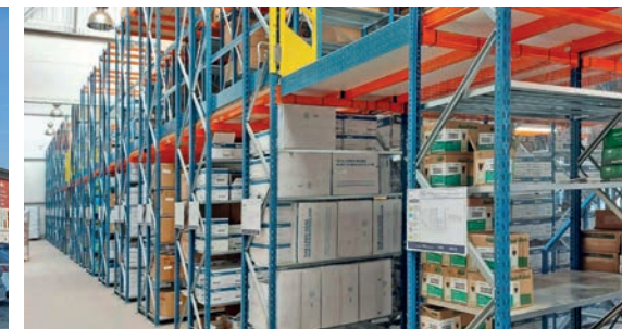
Magazyn Centralny / Central warehouse