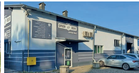
Oddziały AQUA / AQUA branches